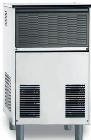
BF 80 AS/WS

BARLINE è prodotta in Italia nel moderno e certificato stabilimento Scotsman Ice di Pogliano Milanese secondo le più severe e riconosciute prassi industriali: progettazione e realizzazione per soddisfare le esigenze dei Clienti, sempre attenti ad avvalersi di macchine in grado di assisterli al meglio nella loro attività professionali. Il risultato è un produttore di ghiaccio robusto, realizzato con componenti selezionati e testati: ogni macchina è provata al termine delle fasi di assemblaggio e proposta al mercato attraverso una capillare ed efficiente rete di distribuzione. La produzione di ghiaccio è proporzionata alla capacità dello stoccaggio per avere sempre la quantità desiderata al momento del bisogno, le dimensioni sono state modificate per meglio adattare alle condizioni di lavoro richieste; la condensazione ad aria frontale e la disponibilità del raffreddamento ad acqua per le installazioni più onerose completano gli elementi di identificazione dei modelli.