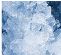
BF 80 AS/WS