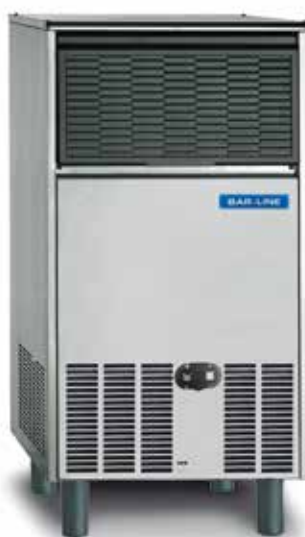
B 7540 AS/WS

La rinnovata gamma di produttori di ghiaccio in cubetti BAR-LINE produce cubetti di forma tronco-conica ad alta efficienza: definiti, limpidi, igienici e robusti per conferire ad ogni bevanda un naturale senso di freschezza.